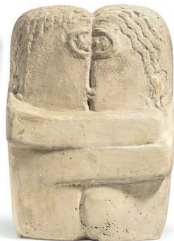
Constantin Brancusi (1867-1957) - Le Baiser