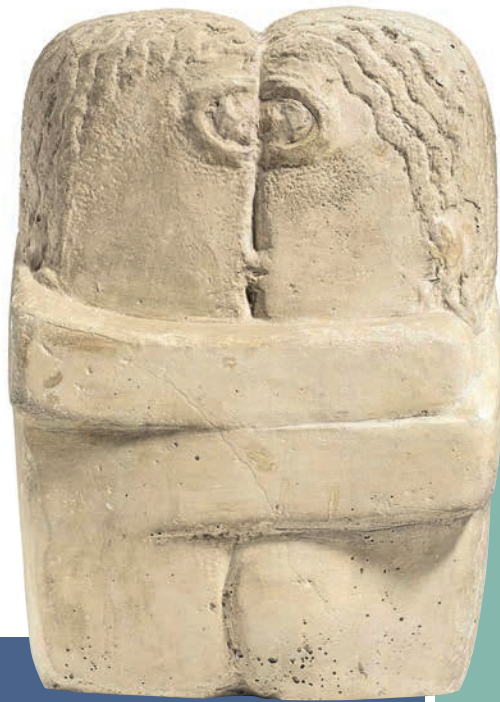
Constantin Brancusi (1867-1957) - Le Baiser